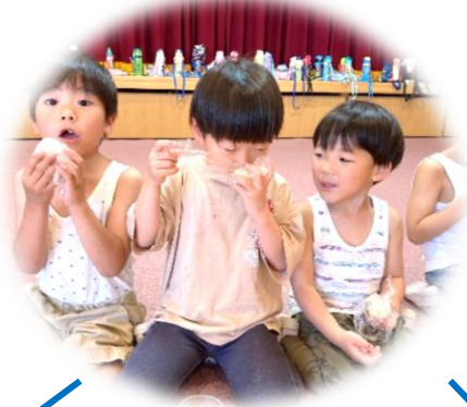
美味しくておかわりできそう!