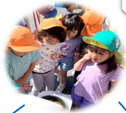
ご飯からお茶のにおいがする～