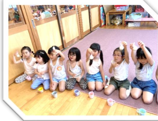
水筒のお茶の色と全然ちがうね～