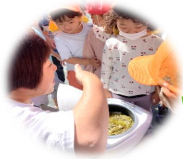
お茶の葉ごはんを🍱にしよう